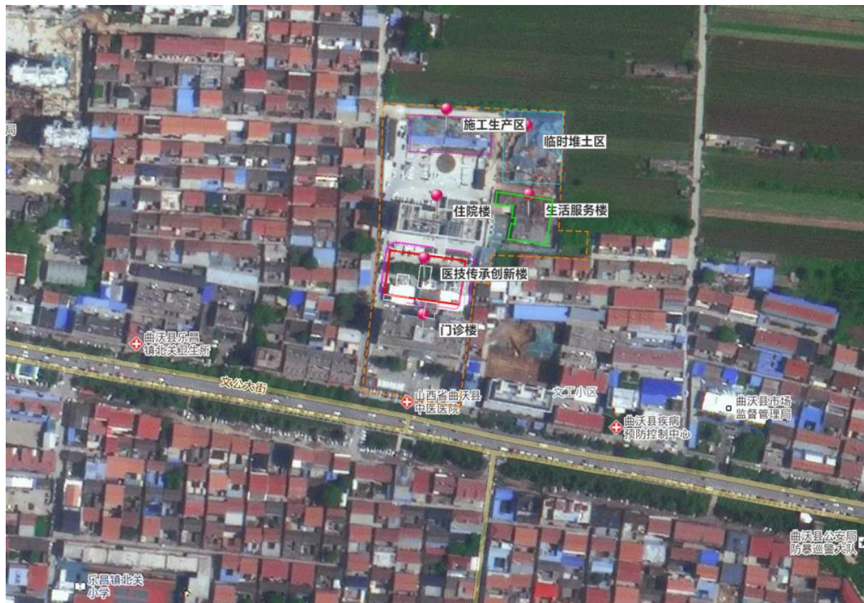
图 2-1 项目区遥感影像图

主体设计在医技传承创新楼主入口、道路两侧及建筑物四周空地采用灌、草结合的绿化方式，创造一个较为优美的环境。绿化树种主要为紫叶李、天目琼花、丁香、胶东卫矛、金叶女贞、连翘、大叶黄杨、三七景天等，绿化面积 689m 2 。