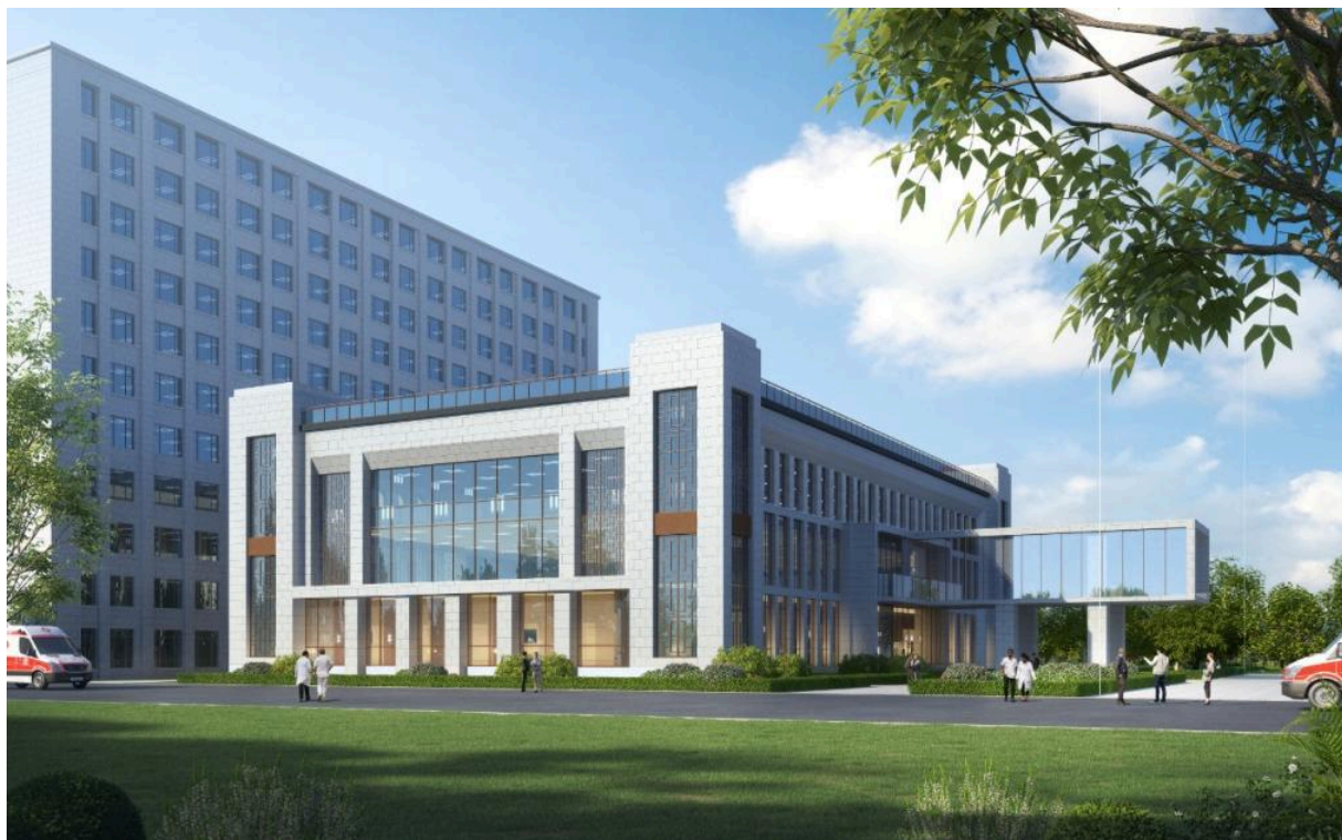
图 2-2 项目效果图